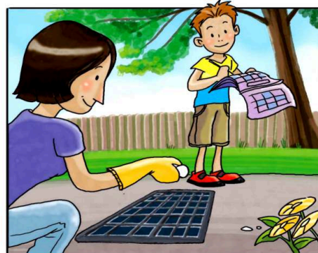
RICORDATI DI TRATTARE I TOMBINI CON PASTIGLIE DI INSETTICIDA, NEL PERIODO DA APRILE A SETTEMBRE. (*)