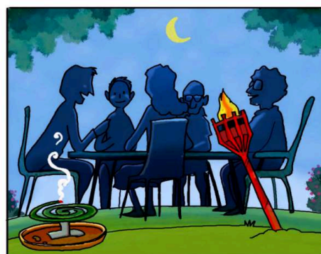
QUANDO SOGGIORNI ALL'APERTO, PROTEGGITI CON REPELLENTI AMBIENTALI. (*)

(*) Leggi attentamente le istruzioni riportate sulle confezioni.