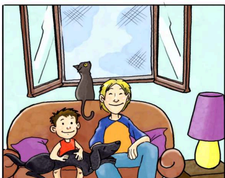
IN CASA USA LE ZANZARIERE ANZICHÉ ZAMPIRONI E FORNELLETTI.