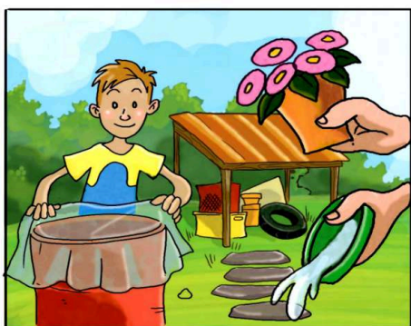
METTI AL RIPARO DALLA PIOGGIA TUTTO CIÒ CHE PUÒ RACCOLGERE ACQUA.

(*) Leggi attentamente le istruzioni riportate sulle confezioni.